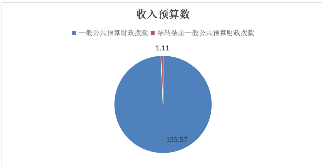
图 1. 收入预算图

本年事业收入 0 万元； 本年事业单位经营收入 0 万元； 本年上级补助收入 0 万元 0； 本年附属单位上缴收入 0 万元； 本年其他收入 0 万元； 上年结转结余的一般公共预算收入 1.11 万元，占 0.71%； 上年结转结余的政府性基金预算收入 0 万元； 上年结转结余的国有资本经营预算收入 0 万元； 上年结转结余的财政专户管理资金 0 万元； 上年结转结余的单位资金 0 万元。