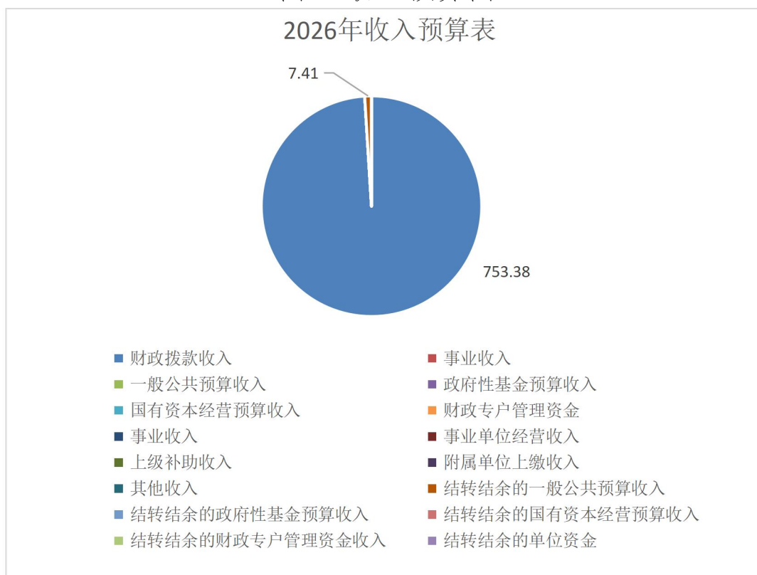
图 1. 收入预算图